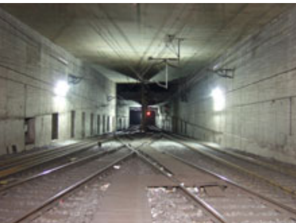
S-Bahn-Tunnel mit Blick von der Hauptwache in Richtung Taunusanlage.